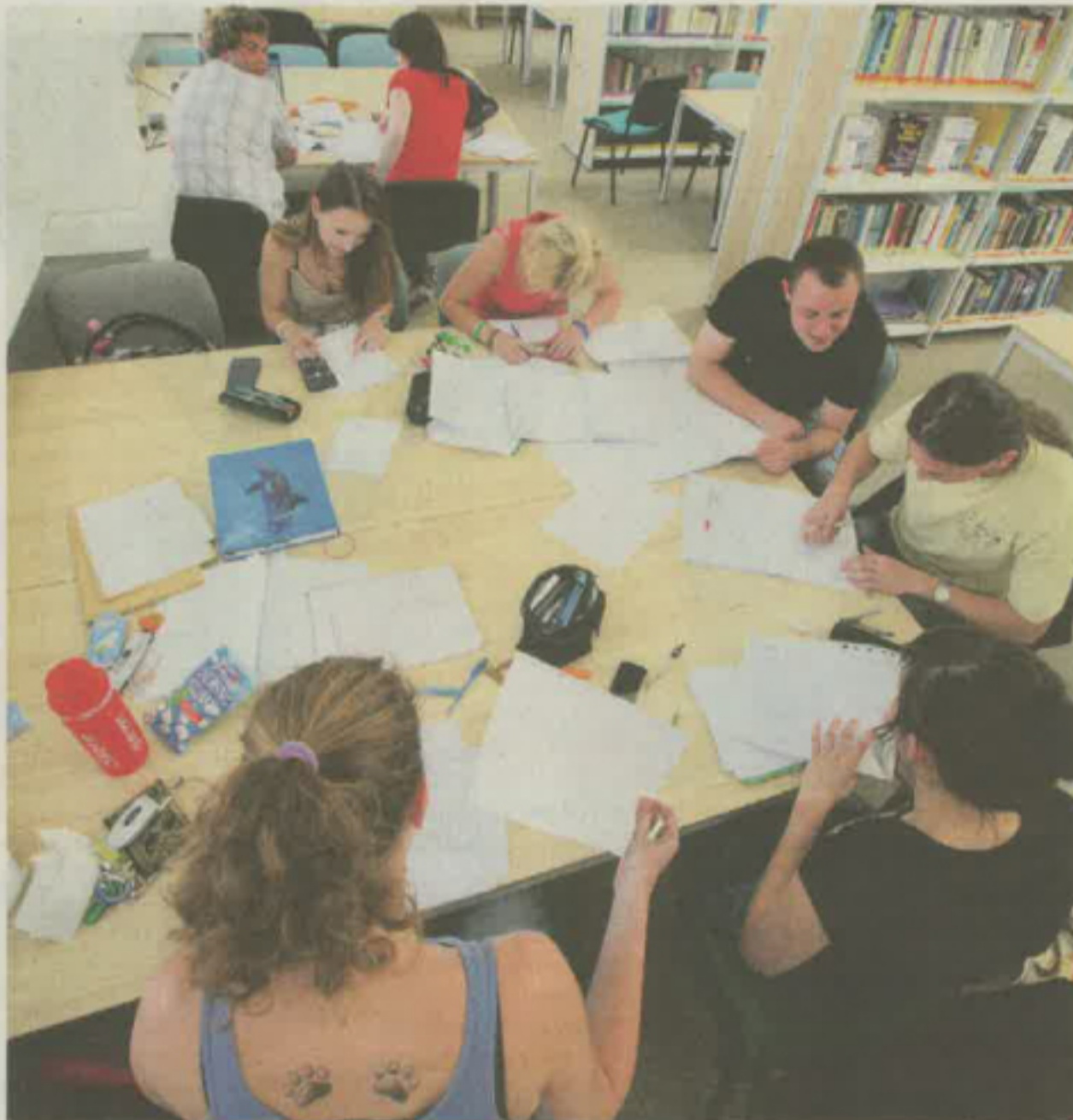
Sociálne štipendium z prostriedkov štátneho rozpočtu Slovenskej republiky sa vypláca len študentom, ktorí študujú na vysokej škole na Slovensku.

Na základe uvedeného je zrejmé, že príslušný orgán postupoval v súlade so zákonom a v prípade, že ste si svoj zákonný nárok neuplatnili, v zmysle § 9 ods. 1 zákona o pomoci v hmotnej núdzi vás príslušný orgán nepovažoval za občana v hmotnej núdzi.