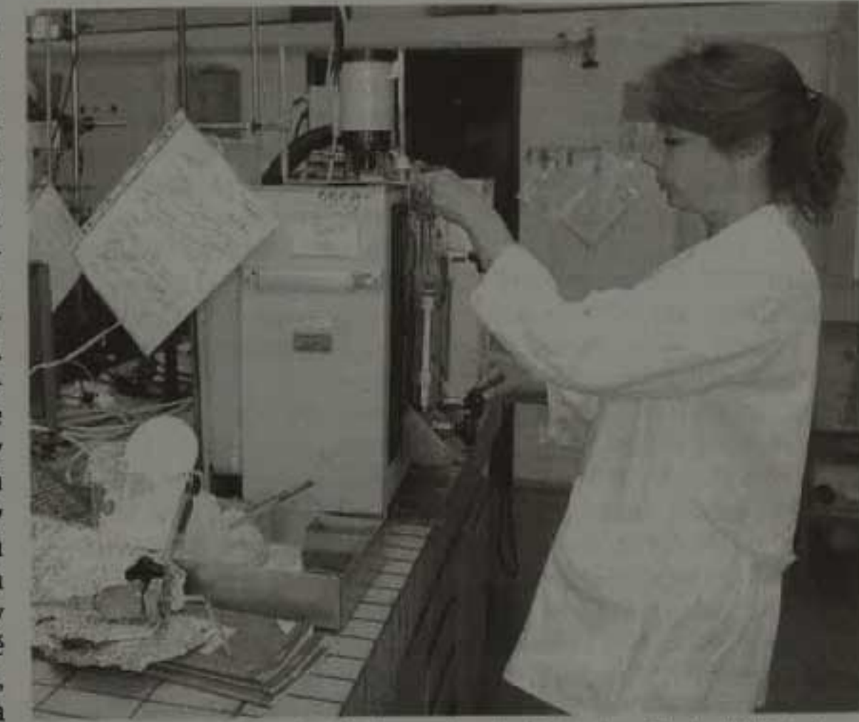
Prapojenie vedy s praxou je prioritou u nás, aj v Slovinsku.